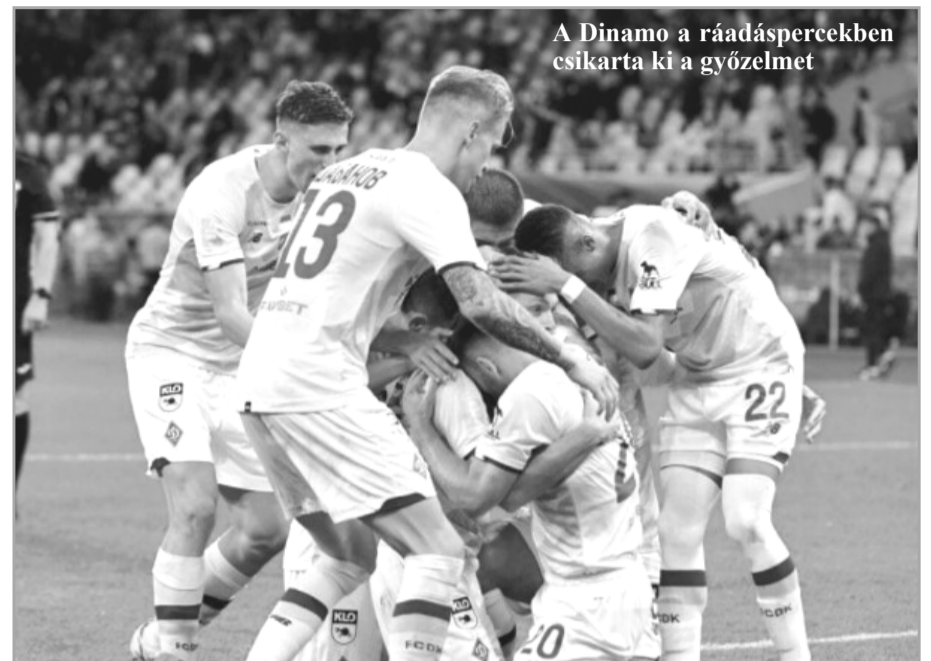
A Dinamo a ráadáspercekben csikarta ki a győzelmet

1-0, Gyeszna Csernyihiv – Ruh Lviv 1-0, Inhulec Petrove – Kolosz Kovalivka 0-2, Dnyipro – Veresz Rivne 1-0, Mariupol – Sahtar Donyeck 0-5, FK Lviv – Met–iszt Harkiv 0-0, Zorja Luhanszk – Csornomorec Odessza 3-0.